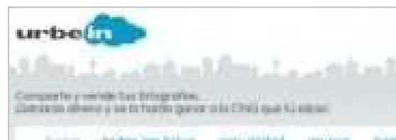
Venta solidaria de fotografías